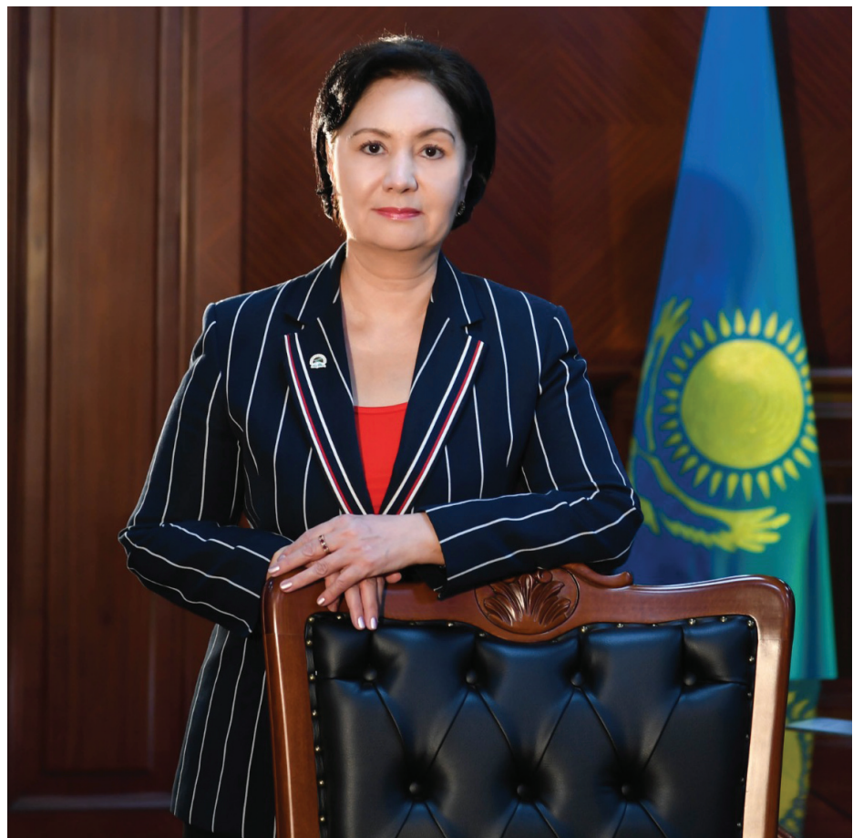
Гүлшара ӘБДІҚАЛЫҚОВА: Қызылорда облысының әкімі: